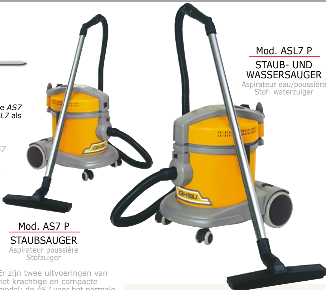
Mod. AS7 P STAUBSAUGER Aspirateur poussière Stofzuiger

Er zijn twee uitvoeringen van het krachtige en compacte model: de AS7 voor het normale stofzuigen, en de ASL7 die, behalve stof, ook vloeistoffen kan opzuigen.