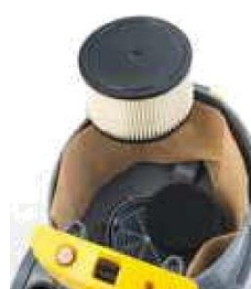
Motorfilter + Filterpatroon