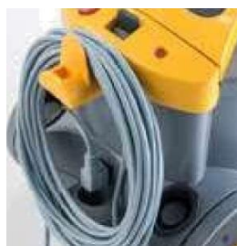
Afneembare kabel 15 meter

TRADE WIND GEAUTORISEERD GIBLI DISTRIBUTEUR