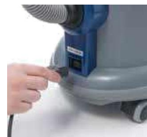
Contact voor Elektro turboborstel