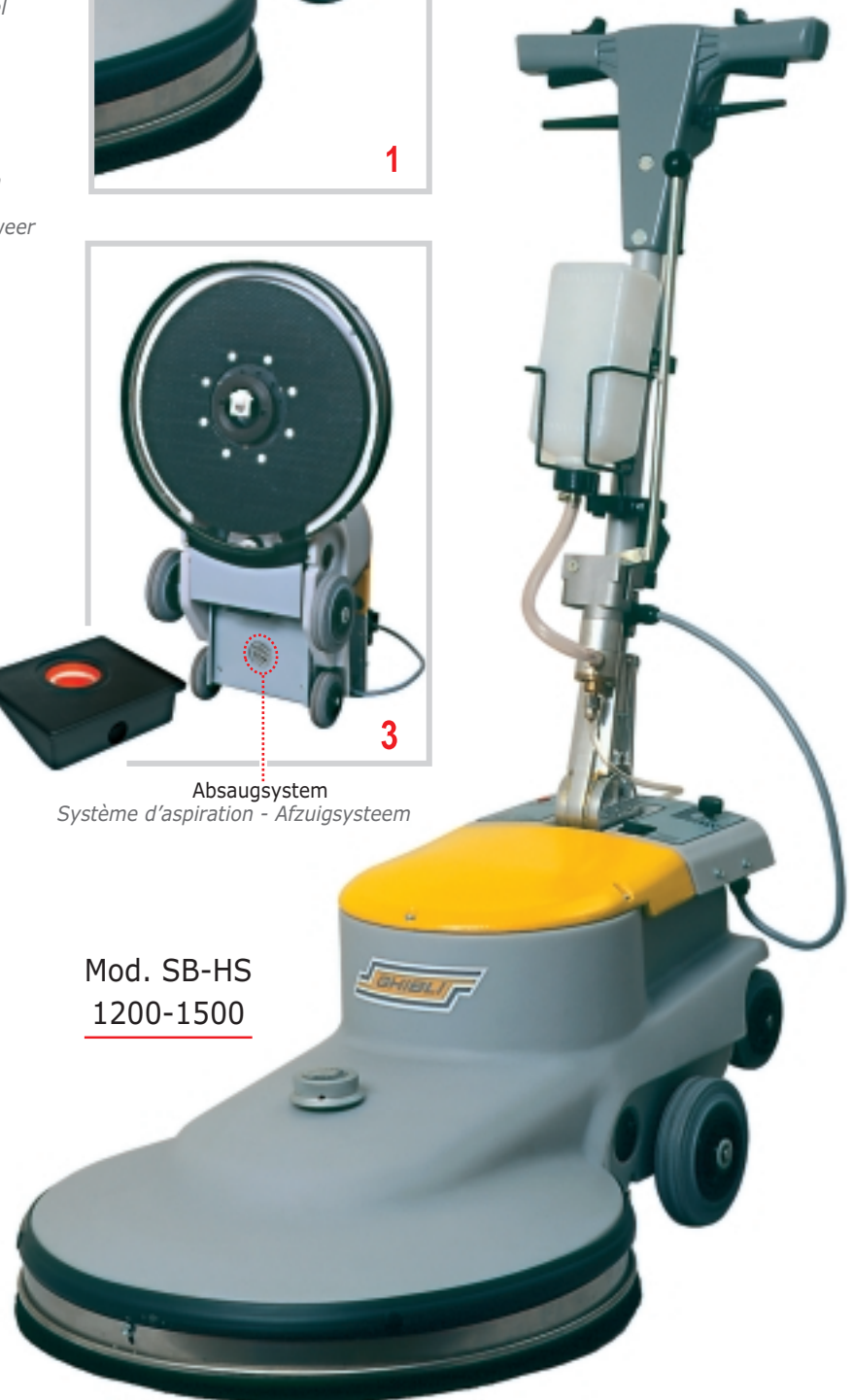
Mod. SB-HS 1200-1500