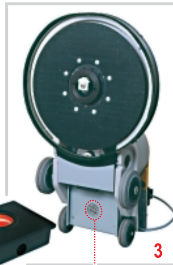
Absaugsystem Système d'aspiration - Afzuigsysteem